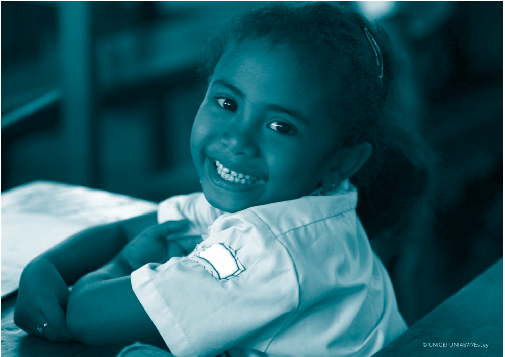
Niña sonriendo. UNICEF/UNI45717. Josh Estey.