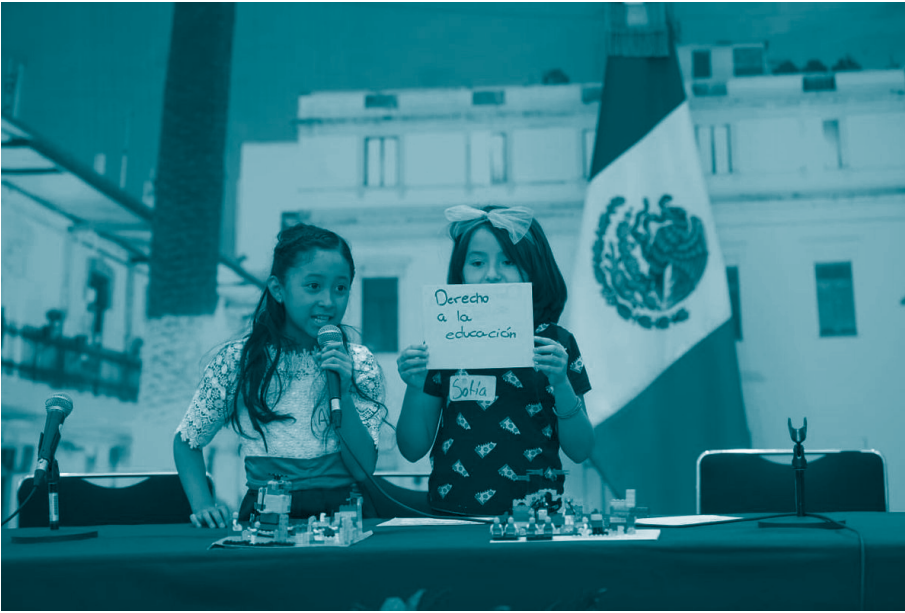
Panel Derechos de Niñas, Niños y Adolescentes. 2019. Red Nacional de Difusores Infantiles de los Derechos de Niñas, Niños y Adolescentes.

Por ende, las escuelas —públicas y privadas— 336 deben proveer las condiciones necesarias para que el derecho a la educación se ejerza en espacios integrados, seguros, libres de violencia, donde la infancia pueda desarrollar sus aptitudes y competencias y puedan aprender los valores que les permitirán convivir en sociedad. 337