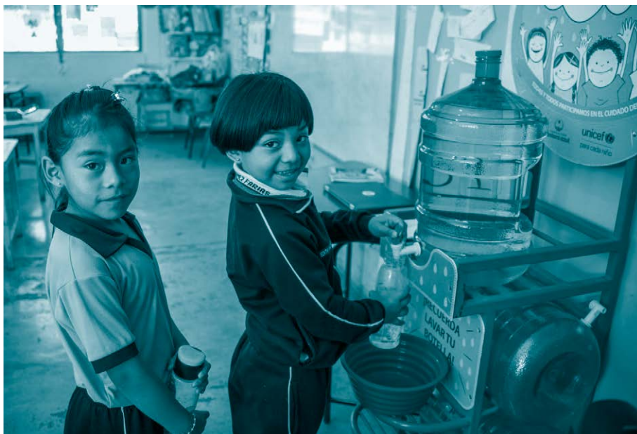
Dos niñas estudiantes de primaria.

Además, comenzó a asumirse la visión del papel de padres y madres como personas obligadas a procurarles cuidado, crianza y cubrir sus necesidades elementales. 24 Esta construcción moderna comenzó a identificar que en la infancia se presentaban otras características distintas de las adultas que necesitaban una atención especializada, lo que incluía una educación particular. 25