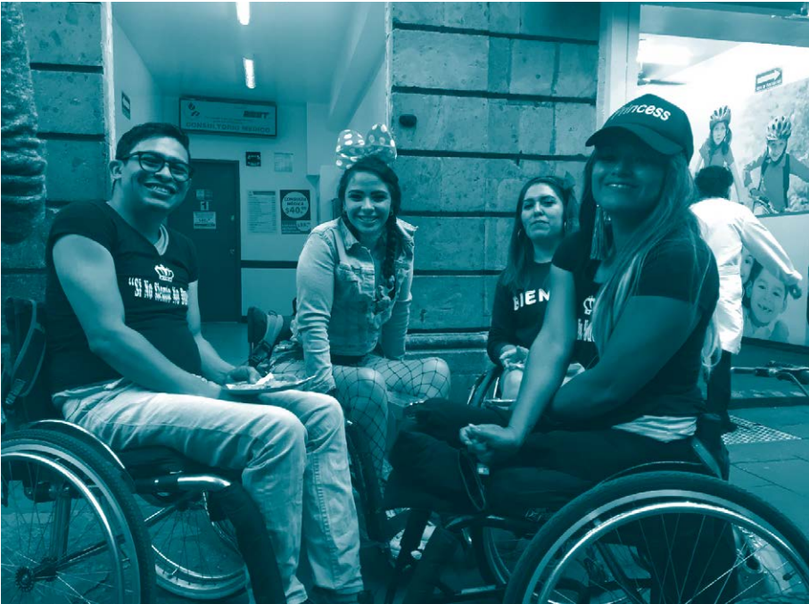
Marcha del orgullo, Ciudad de México, 2019. Milena Pafundi. Archivo Agencia Presentes.

La Corte IDH utilizó el concepto de interseccionalidad de la discriminación por primera vez, precisamente, en un caso que involucraba a una niña. Esto sucedió en el caso Gonzales Lluy y otros vs. Ecuador , en el que el tribunal interamericano señaló que concurrían múltiples factores de vulnerabilidad y riesgo de discriminación en forma interseccional, asociados a la condición de niña, mujer, persona en situación de pobreza y persona con VIH. 216