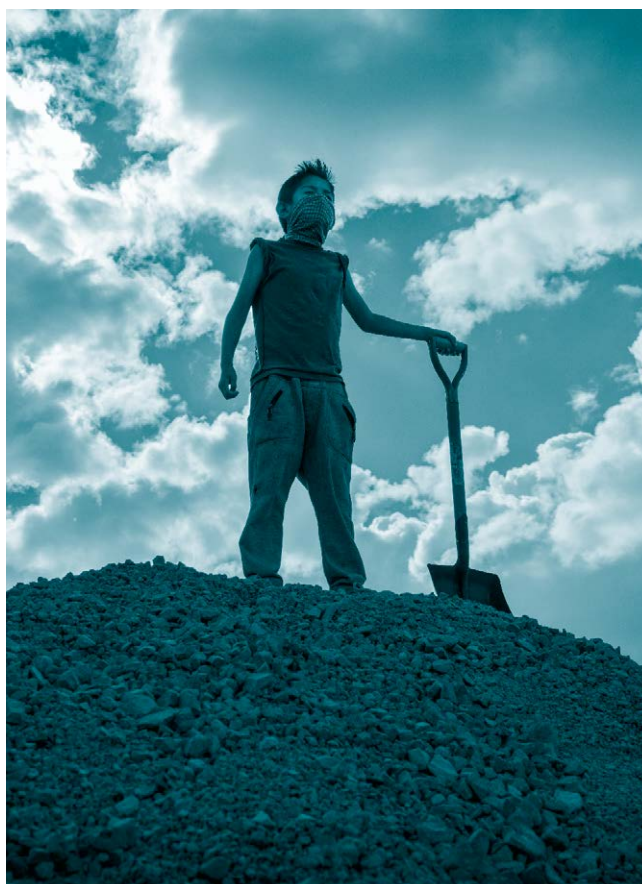
Niño que trabaja en una fábrica de ladrillos.

Éstas pueden ser su edad, sexo, género, identidad u orientación sexual, grado de madurez, experiencia, discapacidad, nacionalidad, etnia, contexto social y cultural, como la ausencia o presencia de progenitores, la convivencia con ellas o ellos, las relaciones entre la NNA y su familia o personas cuidadoras en general, el entorno en relación con su seguridad, así como la existencia de medios alternativos de calidad a disposición de la familia, la familia ampliada o personas cuidadoras, entre otros. 755