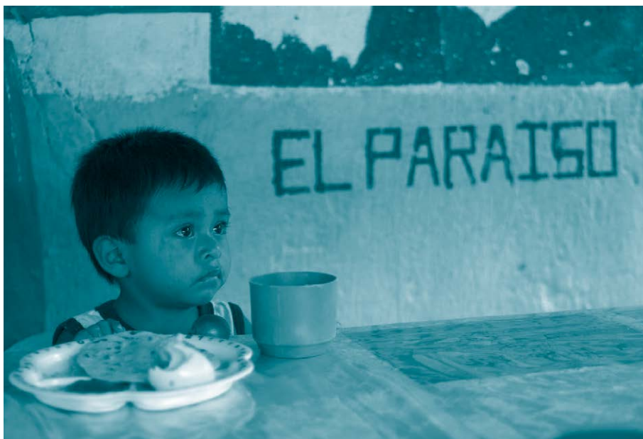
Niño en centro comunitario de Jocotán.

Estas líneas investigativas otorgan una gran relevancia a la interacción entre el papel activo que desempeñan NNA en su propio desarrollo y el entorno que les rodea, sean personas adultas u otras NNA con mayores capacidades. 86 El aprendizaje social es la manera más efectiva para lograr el desarrollo de competencias. Este aprendizaje se lleva a cabo a partir de la interacción y la participación, pues es justo mediante sus propias actividades y la comunicación que establecen con las demás personas, que NNA llegan a conocer y comprender el mundo. 87