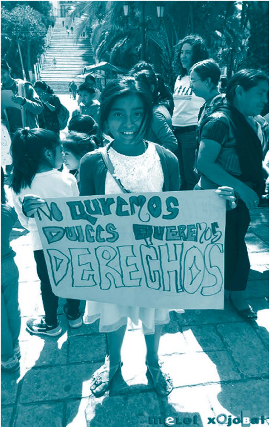
No queremos dulces, queremos derechos. 2015. Melel Xojobal A.C.