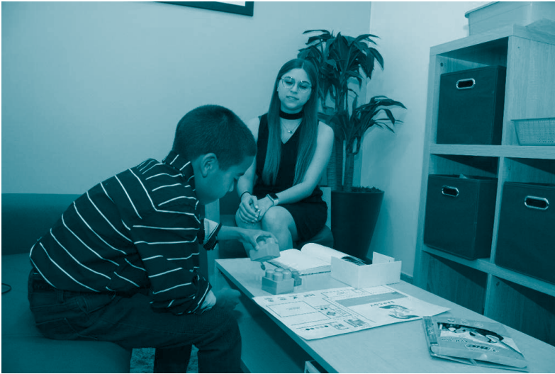
Niño en sala de espera de la SAPCOV de Chihuahua previo a participar. 2021. Fernando Ríos Carrillo.

Además, la persona que realice la evaluación psicológica podría allegarse de información sobre el contexto que puede influir en la entrevista, entre los que destacan la etnicidad, el género, el nivel de desarrollo cognitivo, habilidades comunicacionales, entre otras. 568