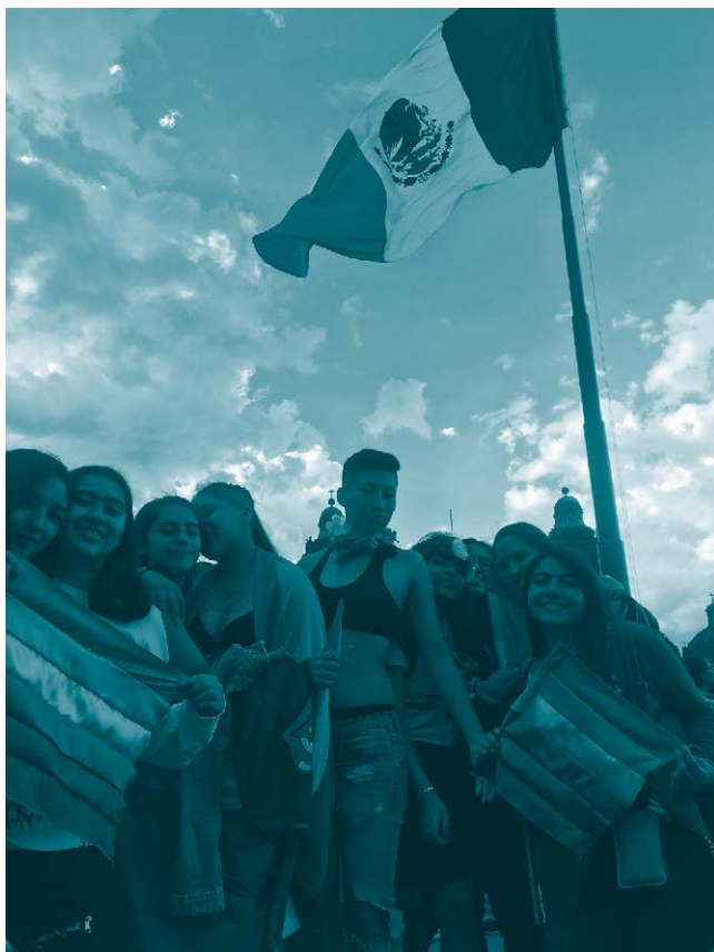
Marcha del orgullo, Ciudad de México. 2019.

Por último, se recomienda ampliamente que las sentencias se dirijan a las infancias y adolescencias tal como se autodeterminen, sobre todo cuando pertenezcan a las disidencias de género y sexuales. Esto incluye referirse tanto a los nombres elegidos —en caso de que ellos varíen de los registrados legalmente— como a los pronombres con los que se identifiquen ( ella/el/elle ).