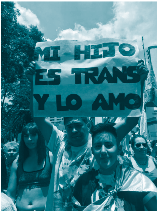
Marcha del orgullo, CDMX. 2019.

En este mismo sentido, la SCJN ha distinguido entre discriminación por objeto y por resultado. La primera, discriminación directa o por objeto, se refiere a aquellos casos en que la distinción, exclusión, restricción o preferencia arbitraria e injusta deriva de las normas y prácticas de manera explícita. La segunda, discriminación indirecta o por resultado, se refiere a aquellos casos en que las normas y prácticas son aparentemente neutrales, pero el resultado de su contenido o aplicación constituye un impacto desproporcionado en personas o grupos en situación de desventaja histórica, sin que para ello exista alguna justificación objetiva y razonable. 188